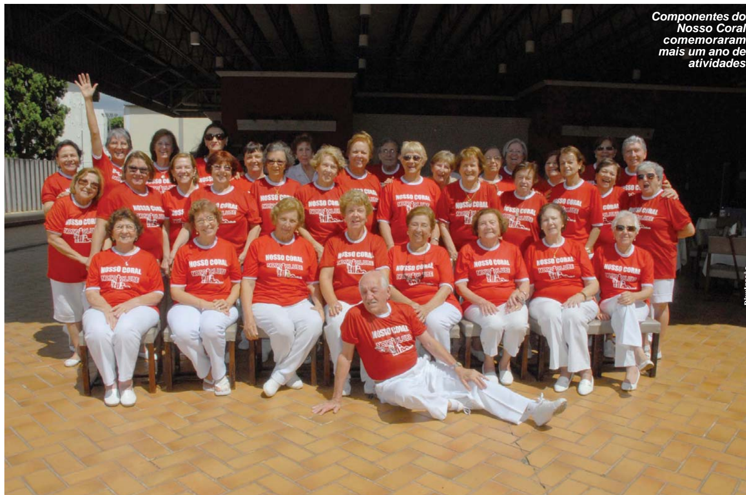
Componentes do Nosso Coral comemoraram mais um ano de atividades

Almoço realizado na Chácara Medina marcou a data especial com muita música